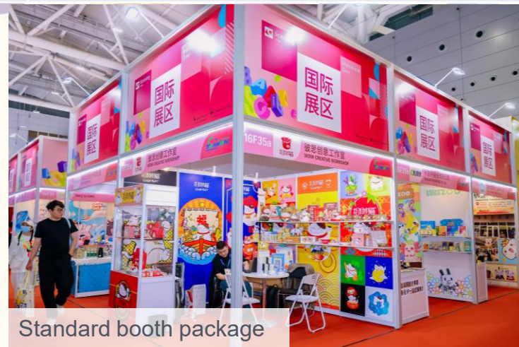
Standard booth package