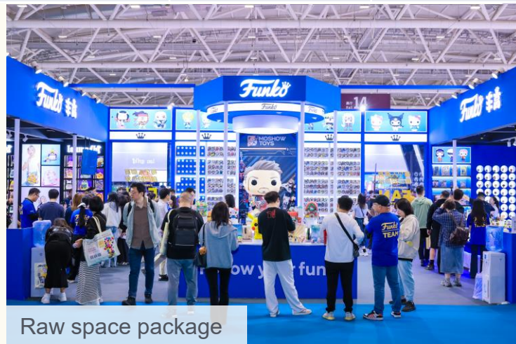
Raw space package